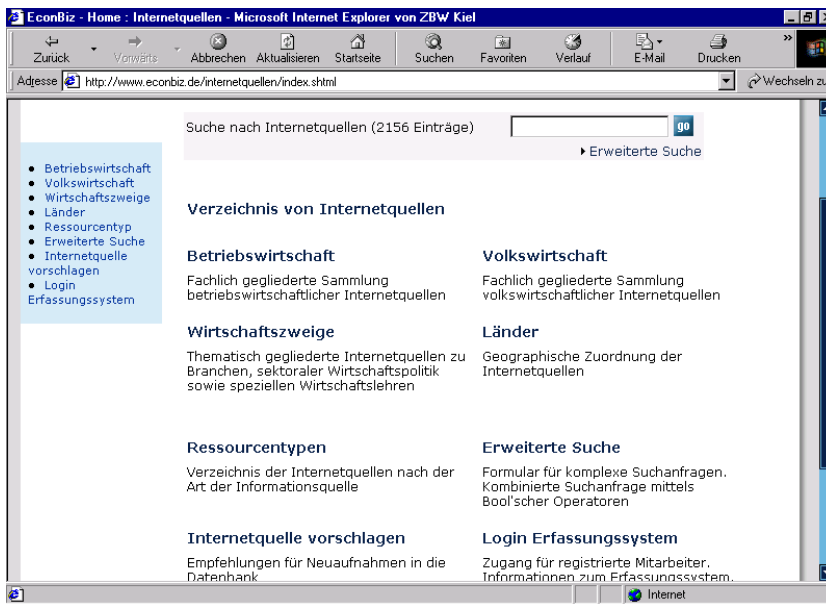
Abb. 2: Einstieg in den Fachinformationsführer